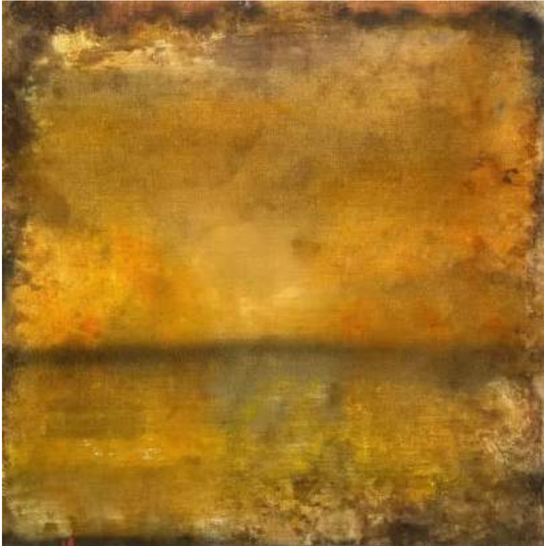
Genius Loci TTOZOI