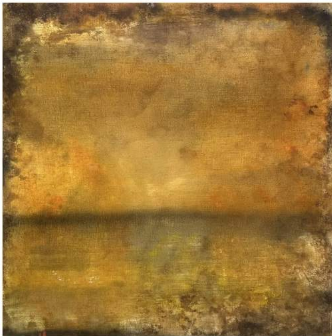
TTOZOI, Genius Loci - Colosseo, cm 186x186

Il duo artistico Stefano Forgione (1969) e Giuseppe Rossi (1972), che opera sotto lo pseudonimo TTOZOI , arriva al Museo Carlo Bilotti Aranciera di Villa Borghese , Villa Borghese dal 6 giugno al 15 settembre