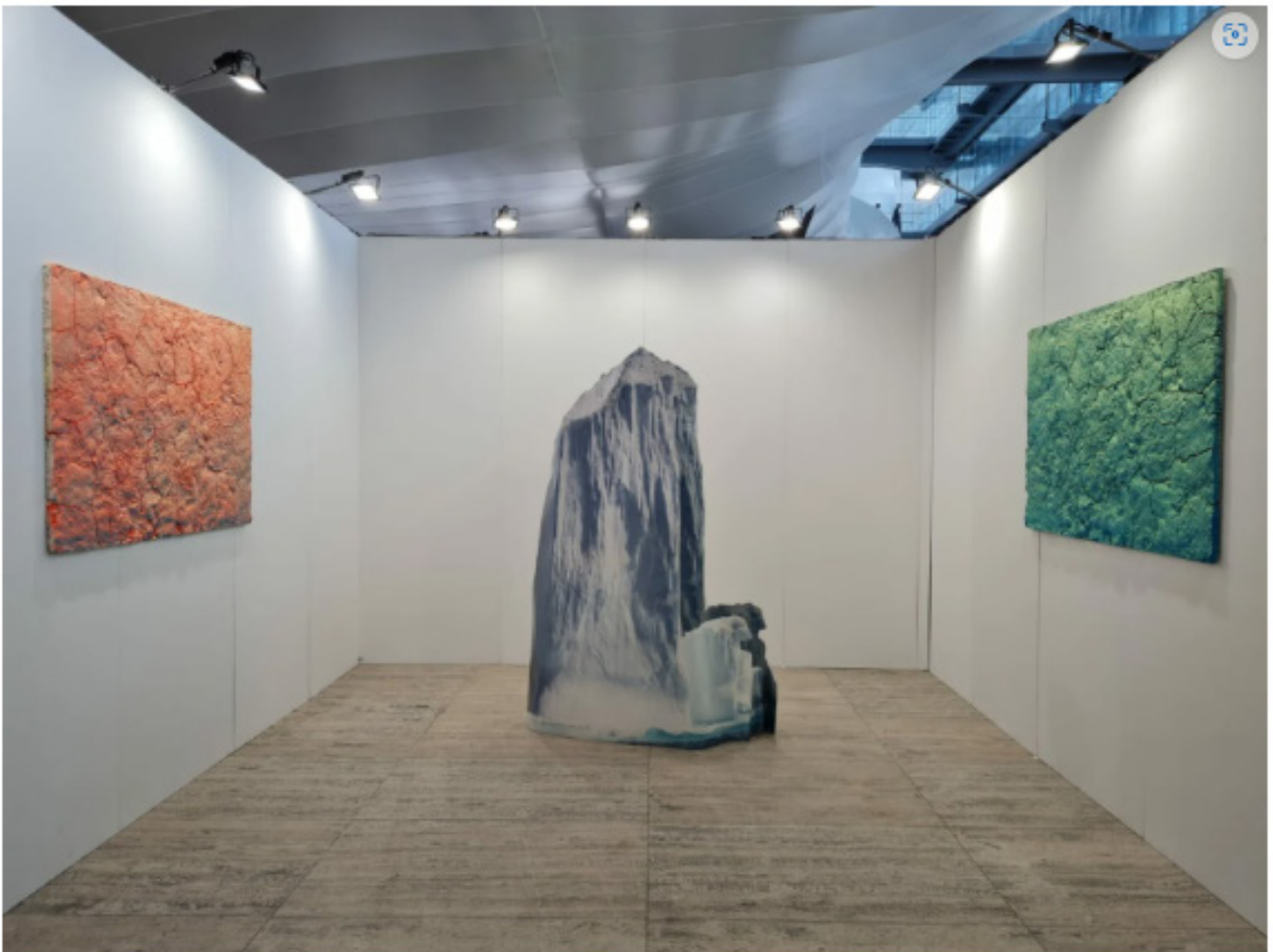
Arte in Nuvola 2022, Wem Gallery